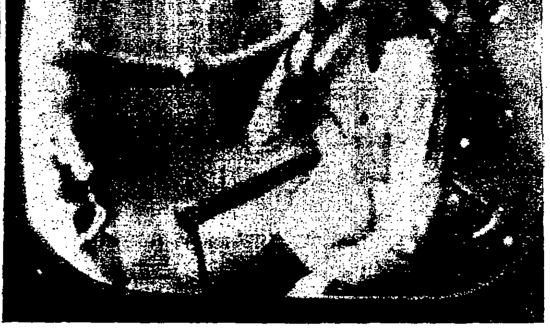
يستطيع الاطباء مراقبة المريض وهو داخل غرفة الضغط بواسطة التلفزيون وفي الصورة المرفقة كما يبدو على شاشة التلفزيون